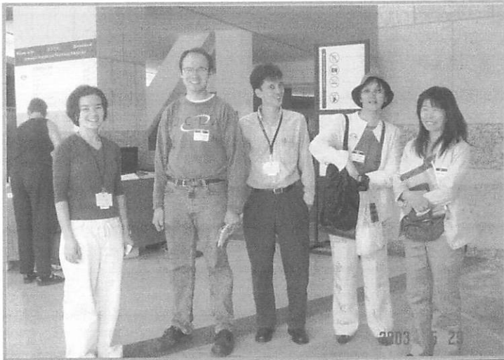
(上) 空港に迎えに来てくれた UCLA の院生たちと。